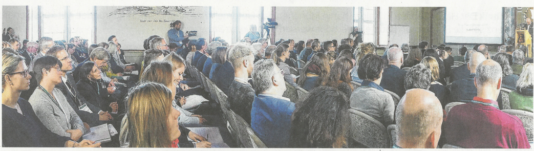
Über 200 Vertreter der deutschen Bio-Branche und dem Lebensmittelhandel haben an den ersten Öko-Marketingtagen auf Schloss Kirchberg teilgenommen.